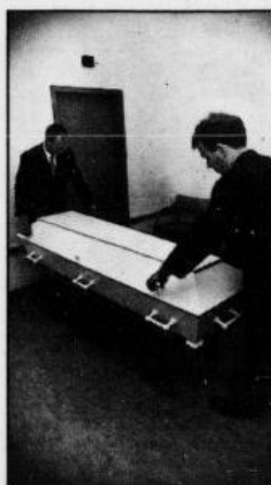
Lokket skrues til med forseggjorte skruer.