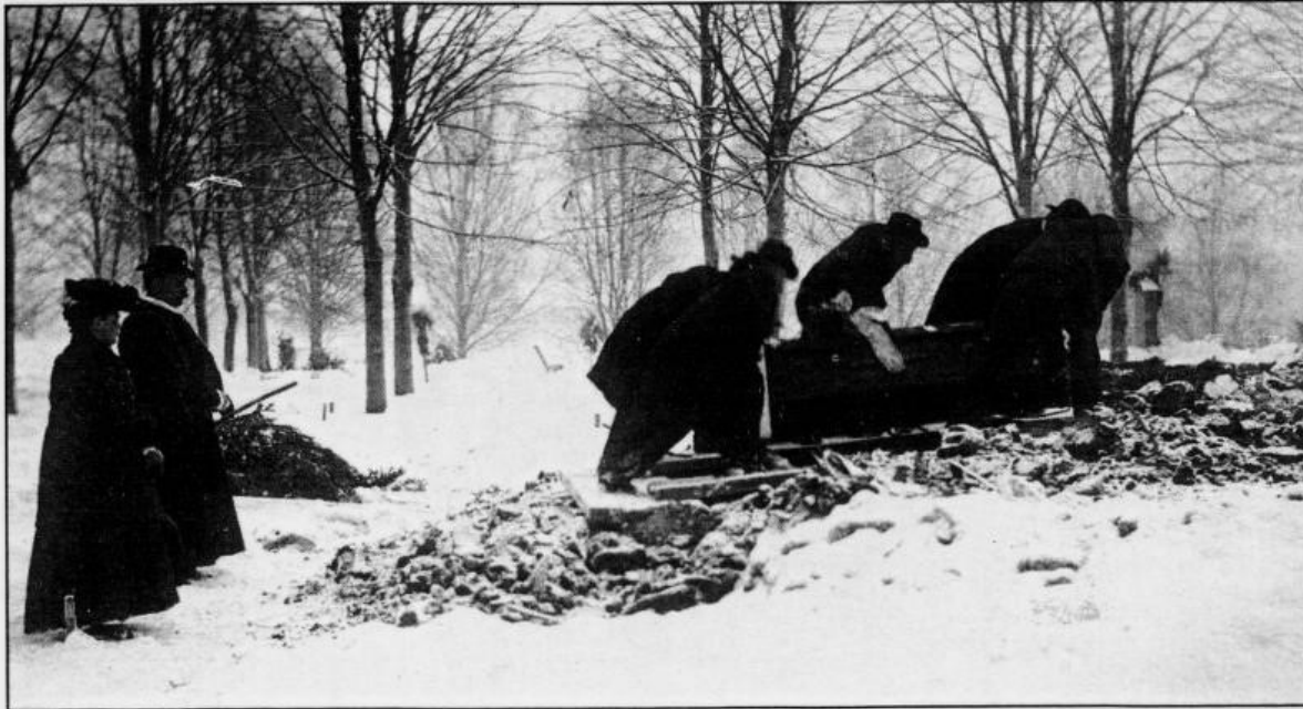
Bybegravelse, Oslo 1907. Fra utstillingen «Døden på norsk».