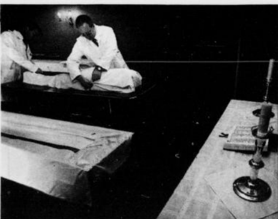
De sorte dressjakkene byttes ut med hvite frakker, når en avdød skal puttes i kista.