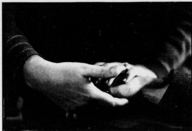
De fleste sykepleiere tar mest i pasienter i forbindelse med andre arbeidsoppgaver.

• Tekst: LINDE BORGEN