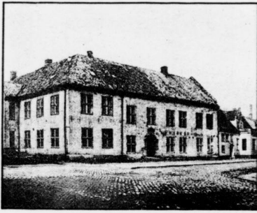
Den staselige kjøpmannsgård Kongens gate 1 på et gammelt bilde fra «Det var en gang en by».